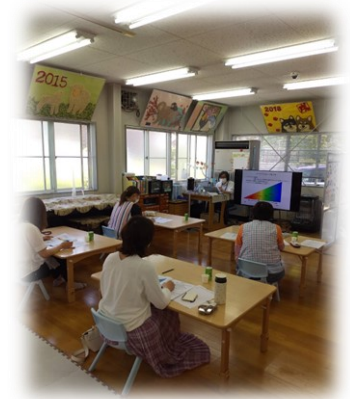
塚本先生には再度講座依頼をする予定です